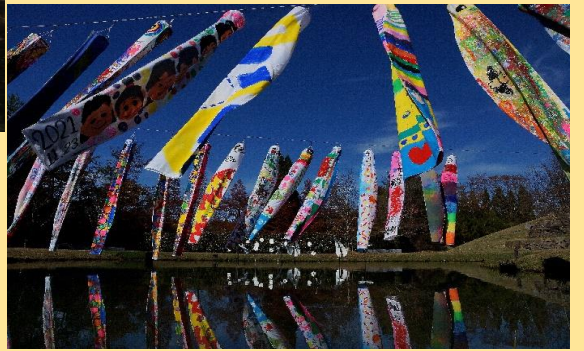
令和3年度 ハッピー賞 大戸 正和 風のミュージアム